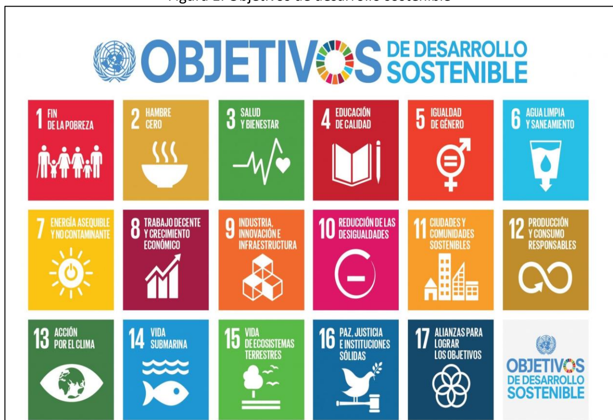
Figura 1: Objetivos de desarrollo sostenible

Los 17 Objetivos de Desarrollo Sostenible (ODS) de las Naciones Unidas son un conjunto de metas globales diseñadas para abordar los mayores desafíos de la humanidad, incluyendo la erradicación de la pobreza, el cambio climático y la justicia social, todo en el marco de la sostenibilidad (Gil, 2018) tal como se muestra en la Figura 1, . El conocimiento de los Objetivos de Desarrollo Sostenible (ODS) asociados a la Agenda 2030 ayuda a evaluar el punto de partida de los países a analizar y formular los medios para alcanzar esta nueva visión del desarrollo sostenible, son una herramienta de planificación y seguimiento para los países, tanto a nivel nacional como local, gracias a su visión a largo plazo, constituirán un apoyo hacia un desarrollo sostenido, inclusivo y en armonía con el medio ambiente (Camarán et al., 2019).